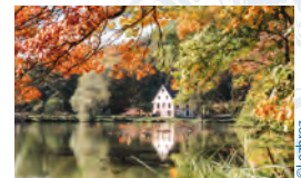
L'étang du Moulin